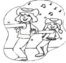
My mom and I dance at the festival