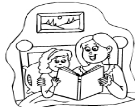
My mom and I read the book