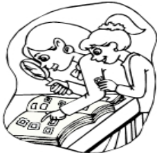
My mother and I collect stamps