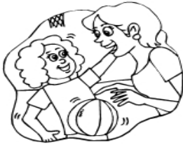
My mom and I