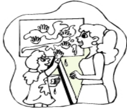
My mom and I paint a picture