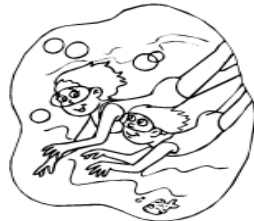
My mom and I swim in the sea