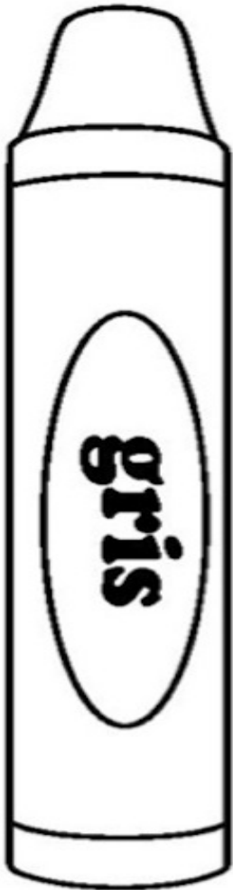
lápices de colores gris