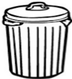
bote de basura