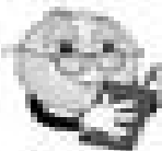
Il est/Elle est amusé(e), drôle.